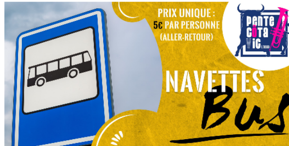
Pentecôtavic 2023 : des navettes entre Auch et Vic !

A l'occasion des festivités de Pentecôtavic, en partenariat avec le Préfet du Gers et le Département du Gers, des navettes sont mises en place entre Vic-Fezensac et Auch.