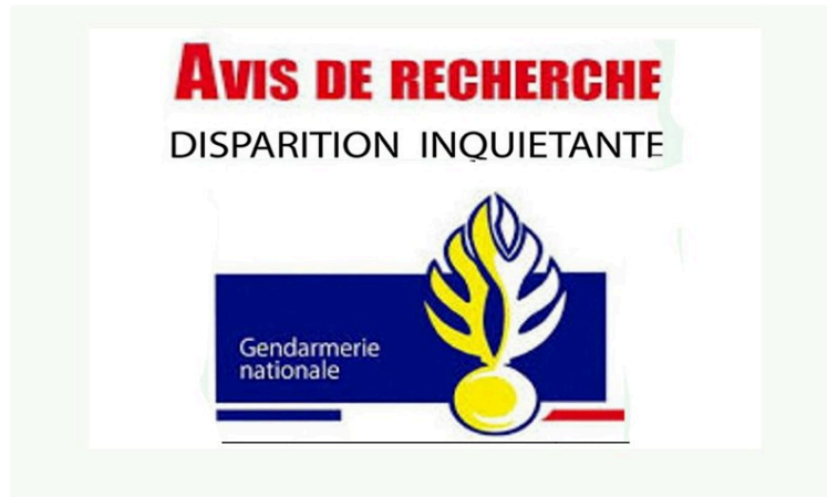
Avis de disparition inquiétante fin de recherche

Le jeune homme recherché a été retrouvé sain et sauf