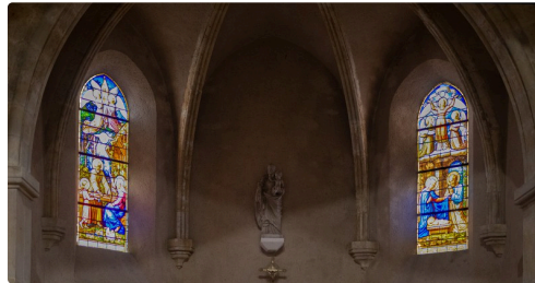
2 vitraux sur le bas-côté droit de l'église