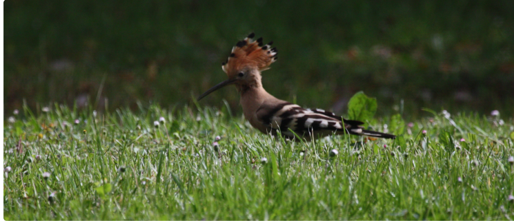
"Oupp-oupp-oupp ", me revoilou !