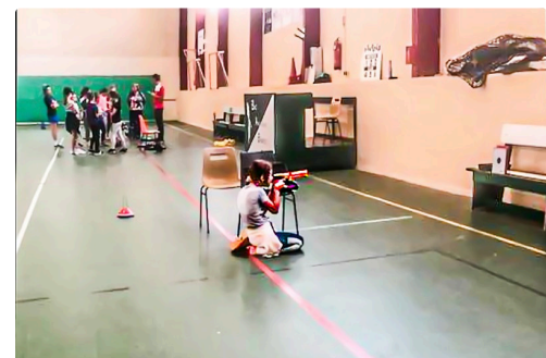
Tir au pistolet laser