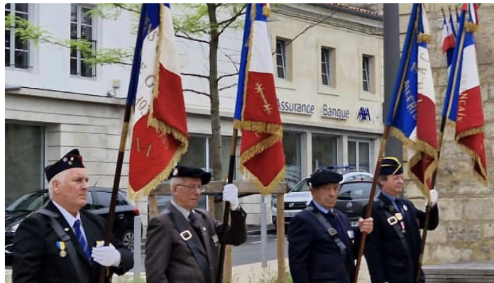
Cérémonie en hommage aux victimes et héros de la déportation.