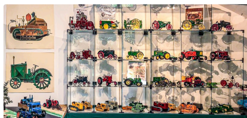
1b DR Musée Toujouse 1bis 270423.jpg