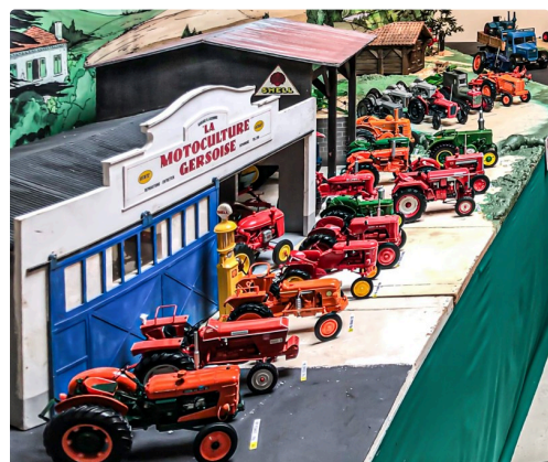
1a DR Musée Toujouse 1bis 270423.jpg

N.B. - Le dessin du haut de page et toutes les photos ont été communiquées par le Musée du Paysan gascon.