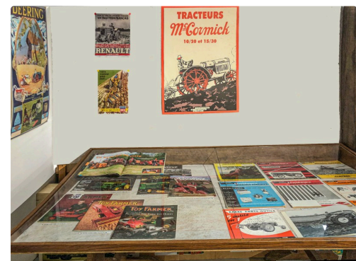
Revue et ouvrages relatifs aux machines agricoles de l'époque 1890-1970