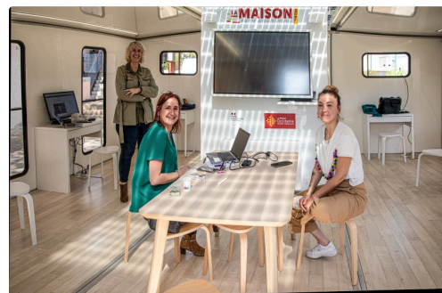
Les 3 consultantes

N.B. - Plus d'information sur la MOM : [ https://www.laregion.fr/MOM ].