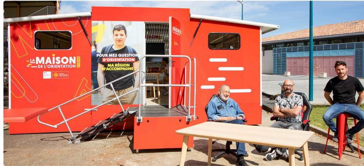
La MOM (Maison d'orientation mobile) de la Région en visité éclair à Nogaro

C'est une réalisation intéressante de la Région Occitanie : les Maisons de l'orientation de Toulouse et de Montpellier disposent de deux Maisons de l'Orientation mobiles (MOM), destinées à venir au devant des jeunes qui s'interrogent sur la voie à prendre, des personnes en recherche d'emploi et des salariés en reconversion.