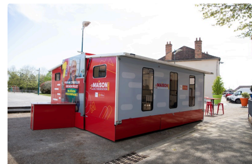
La MOM sous un autre angle