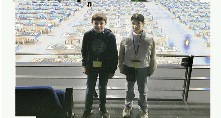
Echecs : le club auscitain compte sur ses futurs champions

Epreuves de championnat de France à Agen