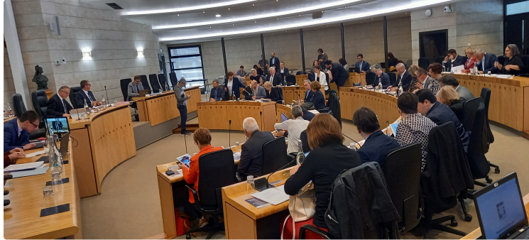
Piste cyclable Auch-Aubiet : le Conseil Départemental a validé la demande de subvention auprès de la Région