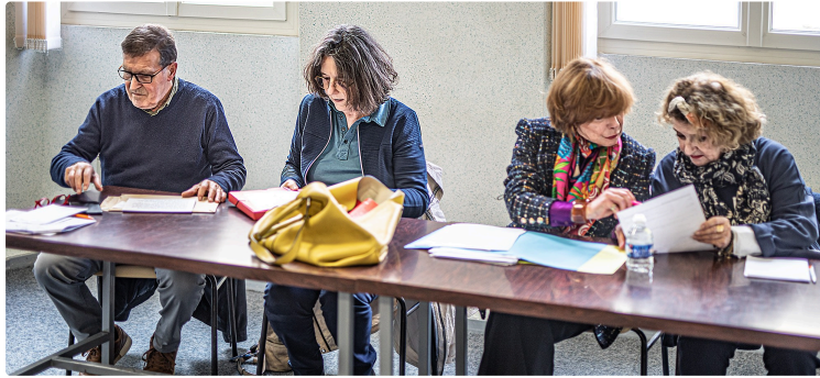
«Gascogne sans poids lourds» touche au but: l'itinéraire D924-931 est déclassé

Après 5 ans d'existence et de combat, l'association Gascogne sans poids lourds (GSPL) arrive au but : un arrêté ministériel du 6 mars 2023 a décidé le déclassement des routes départementales 924 et 931 : ce n'est plus un itinéraire de grande circulation !