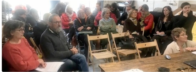
SARRANT Compte rendu des différentes Assemblées Générales

qui ont eu lieu à LaMIS ( Maison de l'illustration de Sarrant )