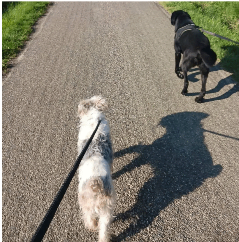
Mowgli bénéficie de l'opération Doyen de 30 millions d'amis.