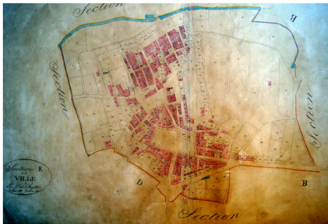
Mauvezin il y a 200 ans