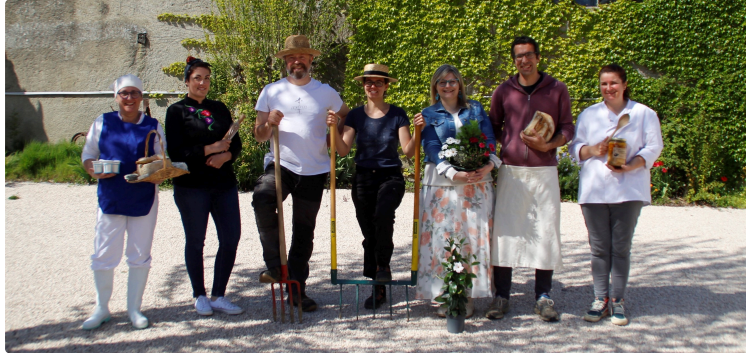
Marché Ô Casaou

Une rencontre mensuelle à vivre avec vos producteurs.