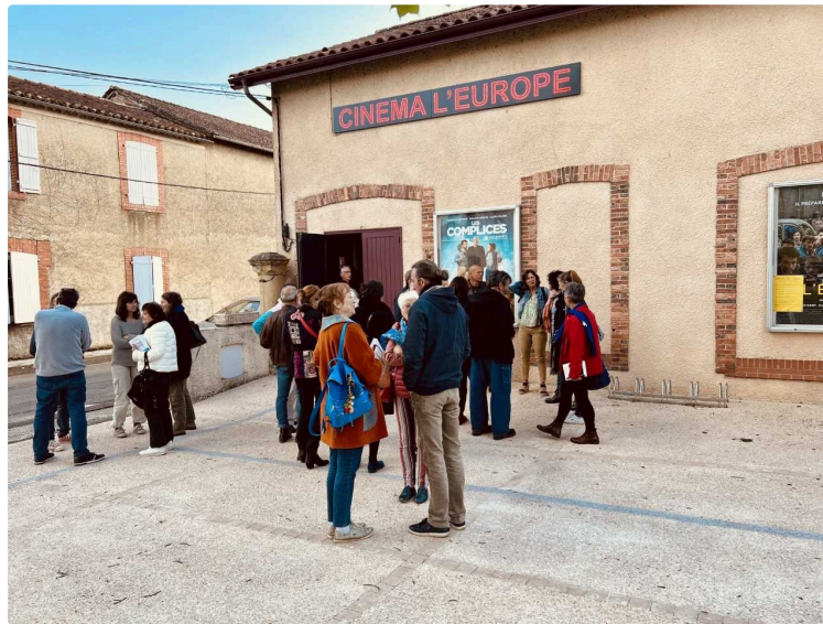
Le cinéma l'Europe de Plaisance devient le pôle de débats intelligents et apaisés !

Voilà un cinéma qui fait avancer la réflexion.