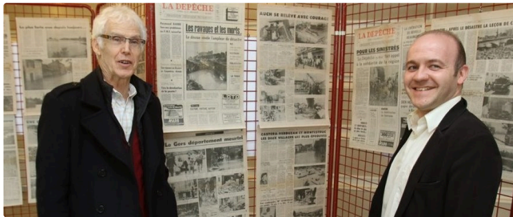
Les Gersois à l'Exposition universelle