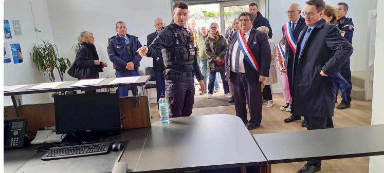
Les nouveaux locaux de la police municipale inaugurés