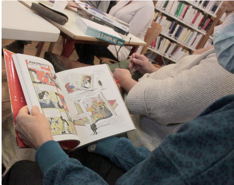
De la BD et du MANGA à la médiathèque

Les lecteurs ont échangé leur passion de la lecture en images