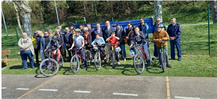
Sécurité routière : Le nouveau DGO est dévoilé

Le document général d'orientation (DGO) en matière de sécurité routière a été validé pour les 5 ans à venir