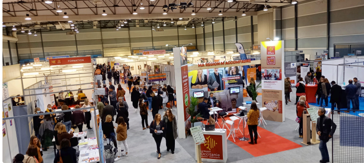
Orientation et emploi, passez par le salon TAF