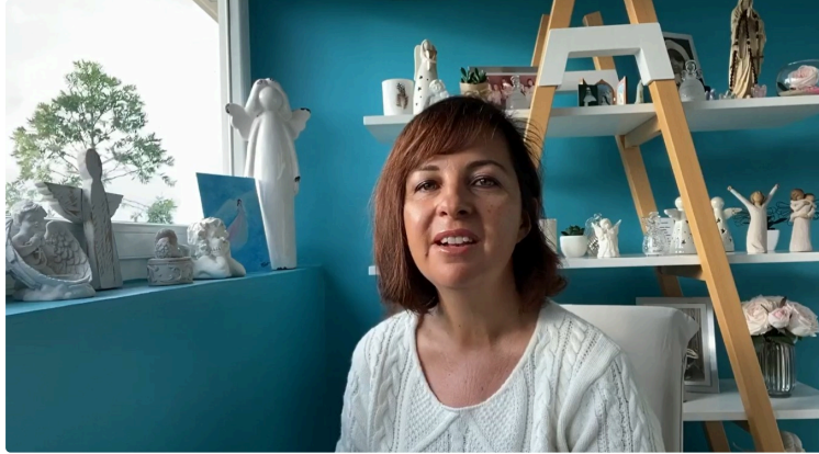
Et si la Mort n'existait pas ? Dimanche 23 avril, dernières places!