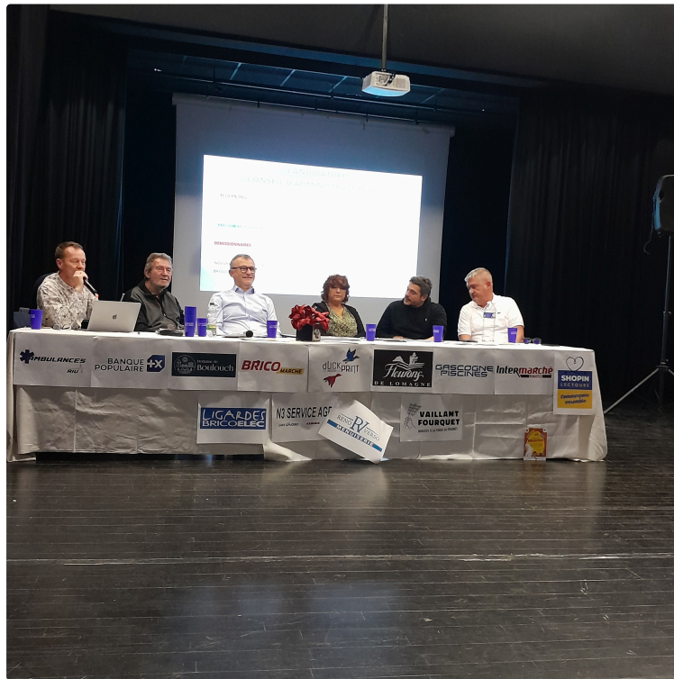
L'AcAl a tenu son assemblée générale

L'association représentera le Gers au concours le panonceau d'or