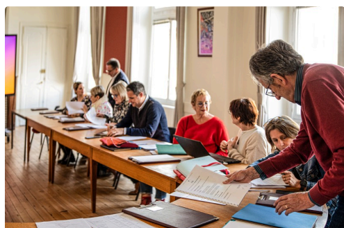
Un côté de lasalle du Conseil