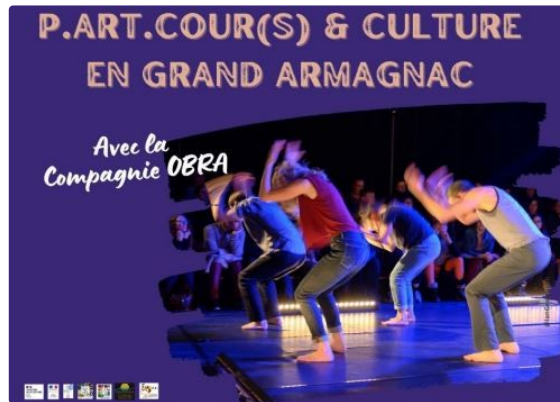
En avril, avec l'ADDA dans le GERS

En partenariat étroit avec la DRAC – Direction régionale des affaires culturelles – d'Occitanie, P.ART.COURS & CULTURE est un dispositif développé par l'Adda du Gers avec la Direction des Services Départementaux de l'Éducation Nationale du Gers.