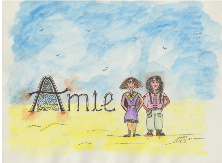
Des historiettes et de l'humour pour enfants à venir dans nos colonnes

Une nouvelle rubrique pour les enfants , rien que pour eux !