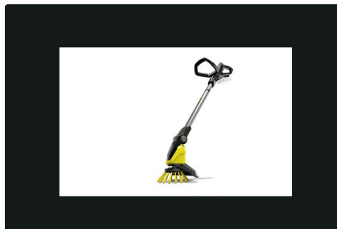
Outil désherbant Kärcher