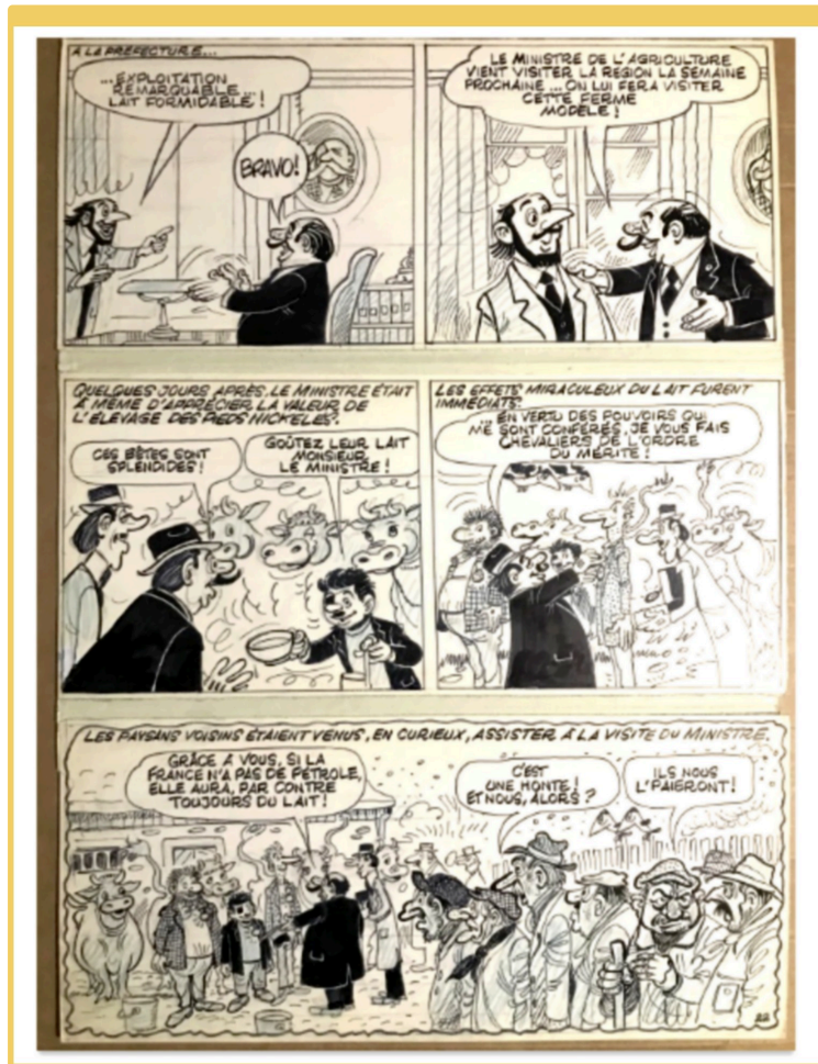
Rencontre autour de la BD et du Manga à la médiathèque

La médiathèque de Pavie propose, en partenariat avec la librairie Le Migou à Auch, une soirée dédiée à la Bande Dessinée et au Manga. Cette soirée se tiendra vendredi 14 avril à partir de 18 h30. Une rencontre qui permettra à chacun d'échanger sur cet aspect de la littérature japonaise dans le cadre du Manga , et de la BD cet autre forme d'expression artistique qui juxtapose dessins et bulles de textes.