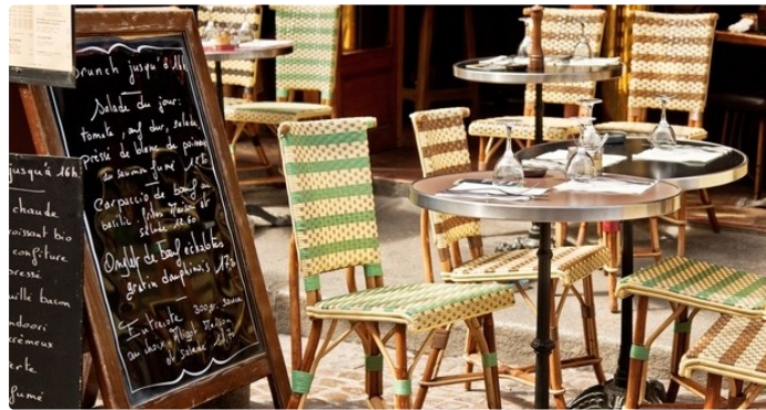
L'UMIH 32 organise son assemblée générale

L'Union des Métiers et des Industries de l'Hôtellerie du Gers organise son assemblée générale