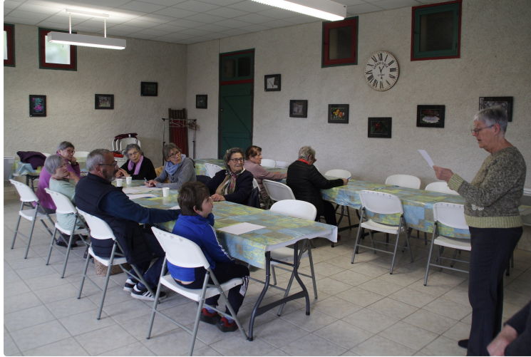
La dictée, un jeu.