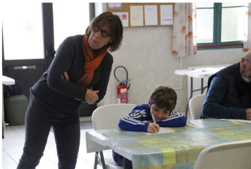
Dictée 01042023 (7).JPG

Une dictée pour faire honneur à la langue française dans la bonne humeur.