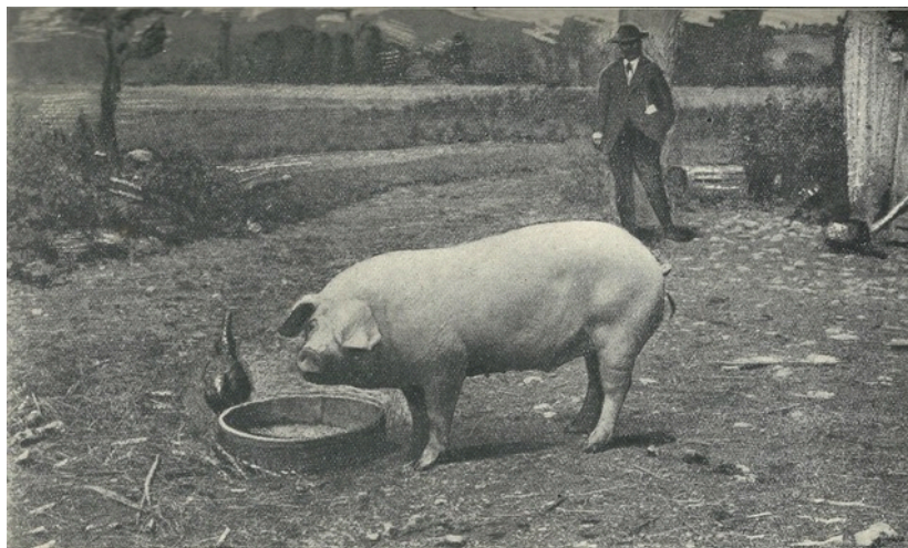
Le verrat "CHAMPION" âgé de 10 mois

L'entrée est libre et gratuite et le groupe vicois de la Société Archéologique du Gers aura le plaisir de vous accueillir pour ce moment de convivialité.