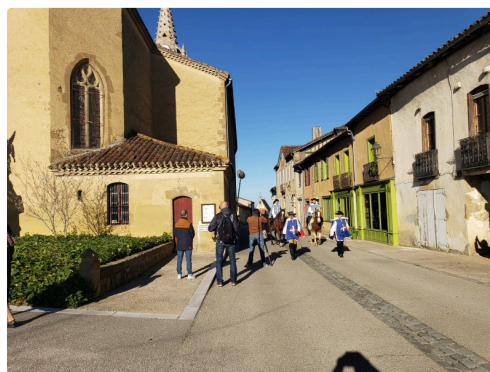
Tournage à Lupiac