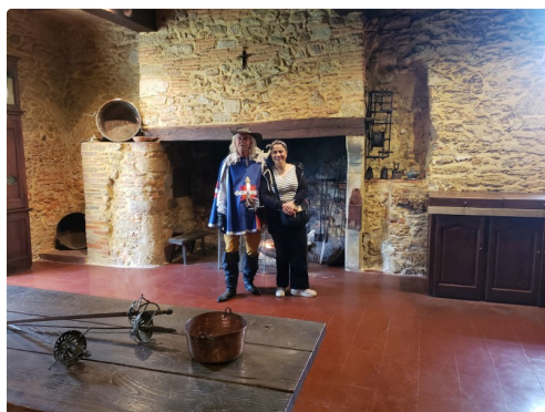
Dans le château de Castelmor, où est né d'Artagnan (photo Maxime Fillos)

(1) Communiqué par Maxime Fillos, Lupiacois actif.