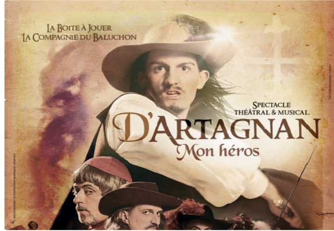
D'Artagnan mon héros revient en tête d'affiche

Après une tournée qui l'a mené de Lupiac à Maastricht, la Boîte à Jouer, propose de nouveau son spectacle théâtral et musical D'Artagnan mon héros à l'occasion de l'anniversaire des 350 ans de la mort de d'Artagnan .