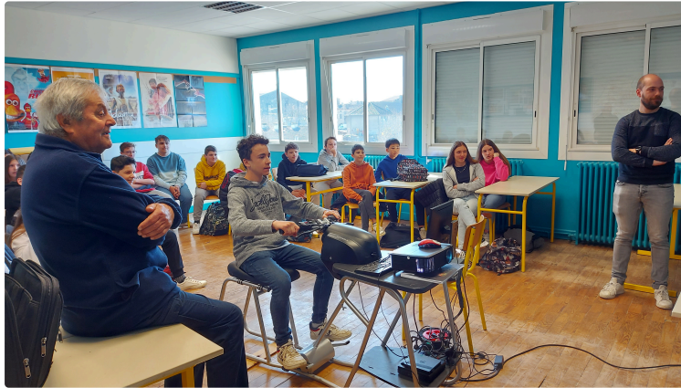
Les collégiens prêts à conduire un deux roues !