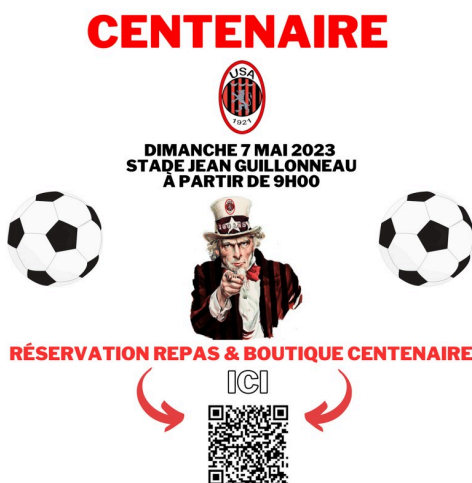
Affiche 3 Centenaire (B).jpg