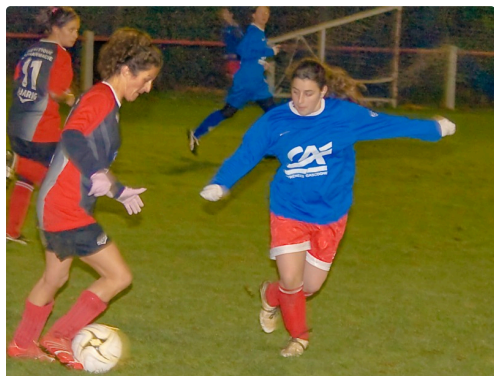
Foot filles Aignan-Duran en 2008