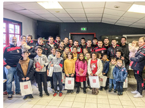
La grande famille des joueurs