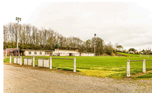
Le stade Jean-Guillonneau