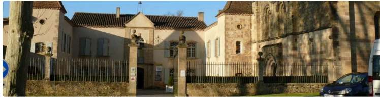
Du côté de l'abbaye de Flaran