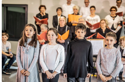
Récitation d'un texte de chanson