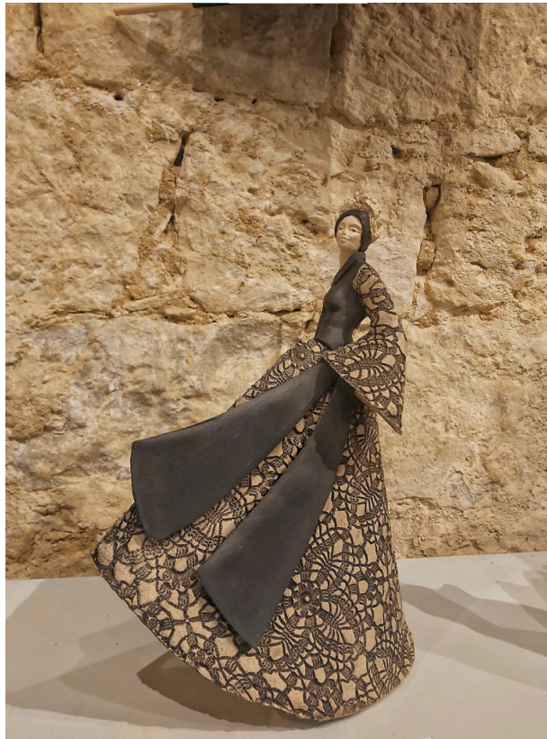
Madame Noir et Blanc par Jeanne-Sarah Bellaïche

Au total c'est le travail d'une trentaine de céramistes qui s'est installé au château.