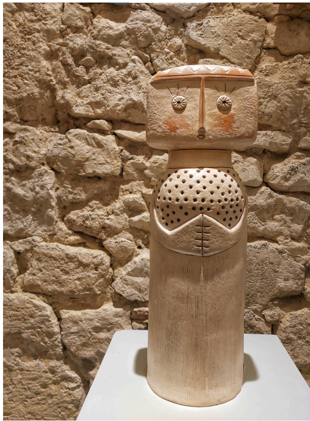
Figure ajourée V par Claude Urban

Monumentales ou utilitaires, abstraites ou figuratives des oeuvres de techniques, matières et univers divers viennent s'emparer des salles pavées d'ocre et de blanc. Parallèlement aux œuvres, des panneaux explicatifs vous permettront d'en apprendre plus sur l'histoire de la céramique ainsi que sur les différentes techniques employées par les artistes.