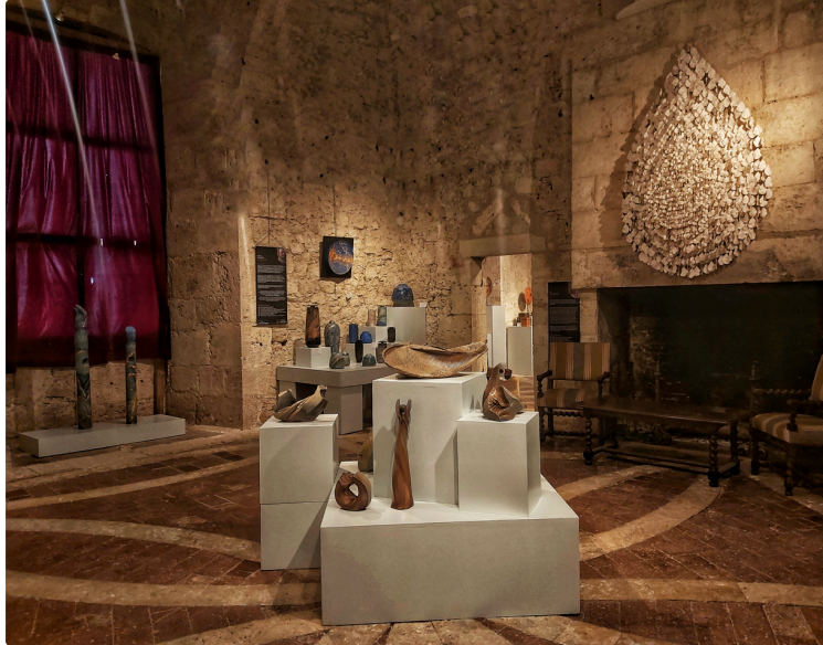
Terre et feu, l'art de la céramique au château de Lavardens

En 2023, la céramique reprend ses quartiers au château, après deux premières expositions en 2011 et 2017, avec l'exposition L'art de la céramique.