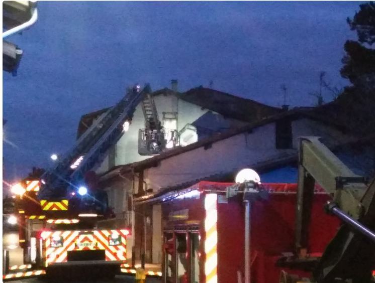
Dernière minute: un toit s'effondre au centre ville

Vers 18 heures arrêt de la circulation rue de l'égalité, un des axes les plus fréquenté du centre ville, par un escadron de la gendarmerie locale. Les pompiers sur place avec la grande échelle, les services techniques, Mr le Maire, un attroupement, principalement les voisins de la maison endommagée sont au pied du sinistre. Le toit de cette maison inoccupée vient de s'effondrer, vraisemblablement une poutre endommagée par une fuite d'eau limportante a cédé.