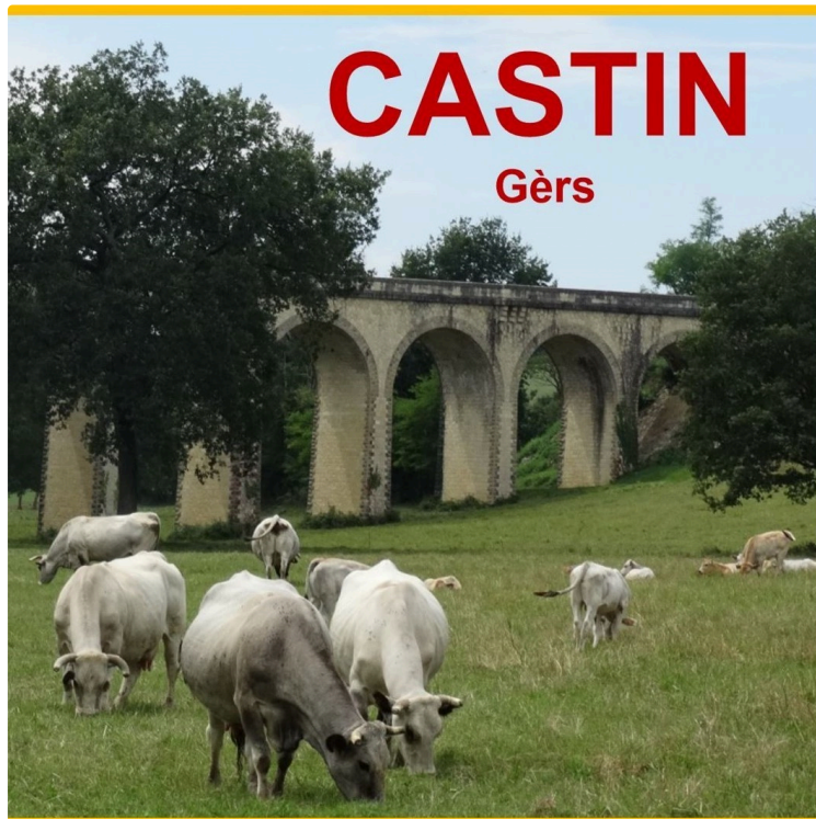
Dimenjada occitana 12/23