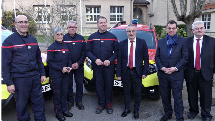
Le SDIS s'équipe pour les feux de forêt grâce au Département

Ce mardi 21 mars 2023 à 18h30 à l'Hôtel du département, Monsieur le préfet et Monsieur le président du conseil départemental du Gers accueillent les autorités ainsi que les personnels spécialisés en feux de forêts du SDIS 32 pour une réception ciblée sur deux thèmes.