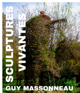
Vernissage de l'exposition "Sculptures vivantes"

Le vernissage de l'exposition "Sculptures vivantes" dans le cadre de la Semaine Verte aura lieu