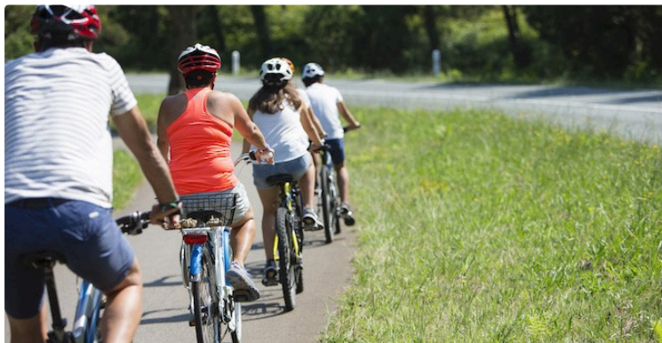
Cyclotourisme : ouverture du CODEP 32 à Vic-Fezensac

L'UAV Cyclotourisme de Vic-Fezensac organise la concentration d'ouverture du CODEP 32