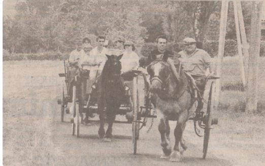
Au temps de l'hippomobile...