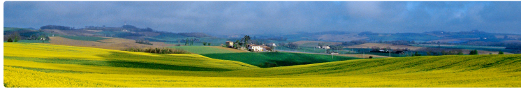
SCoT de Gascogne : de la stratégie à l'action !

Le 20 février 2023, les élus du Syndicat mixte ont approuvé à l'unanimité le SCoT de Gascogne dotant ainsi 397 communes d'une stratégie d'aménagement du territoire marquée par le changement de modèle !