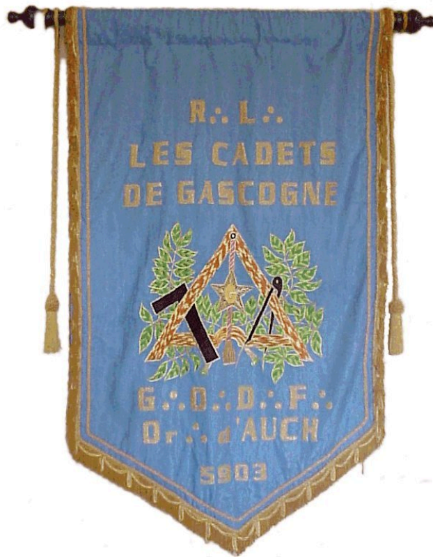
Bannière des Cadets de Gascogne

Photo-titre : intérieur du temple ancien 25 rue de Metz 1868