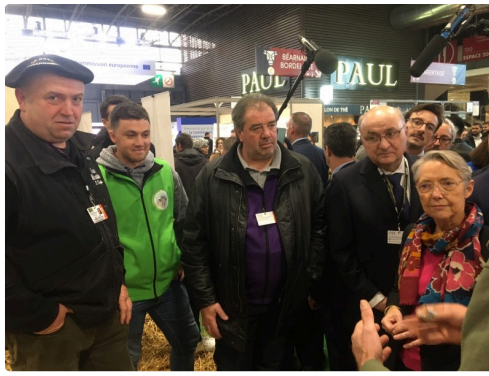
mimosa et 1ere ministre.jpg