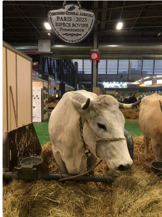
Mimosa, star de la race mirandaïse a retrouvé son étable