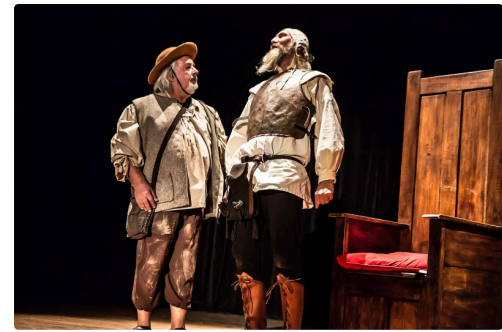
Don Quichotte rencontre Sancho Pança et en fait son écuyer