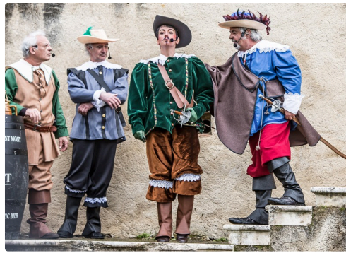
Un gentilhomme cherche querelle à Colinot du Vic-Bilhg