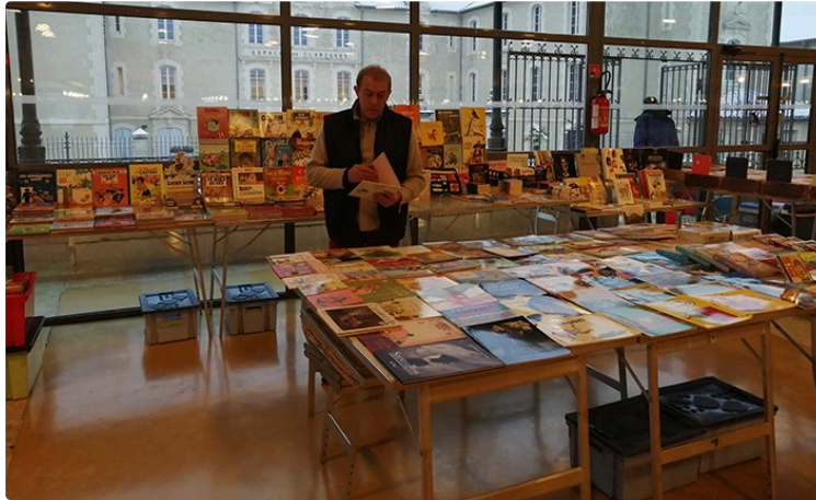
Coups de Plus sur le marché