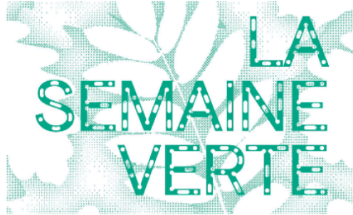
Semaine verte : Chemins de patrimoine agricole